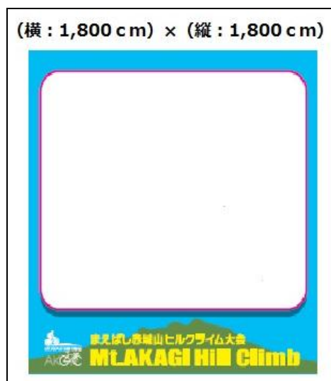
(イメージ：第1回大会スタートゲート)