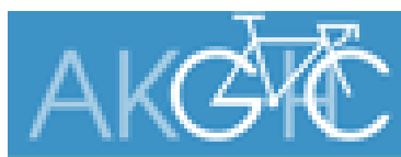
(まえばし赤城山ヒルクライム大会ロゴマーク)